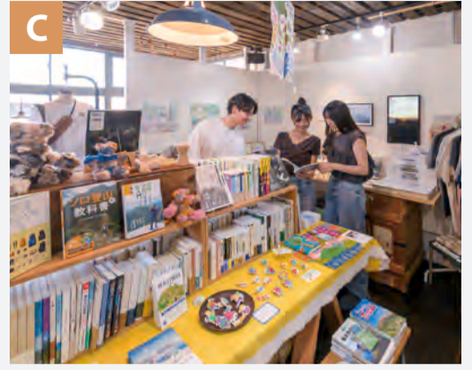
ミセルくらし punto [P.4]

「何よりも自分たちが食べて満足できるクッキーを作っています」という、その姿勢がうれしい。選び抜いた原材料を惜しみなく使用しているのでその分価格には反映されますが、リッチな味わいに価値を感じます。チケット当たりますように！