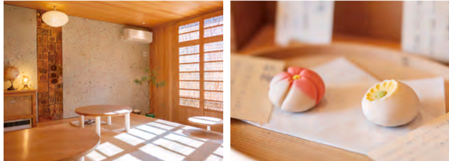
上) 看板メニューの「銅鑼焼き」は、3種類から選べる日本茶とセットでどうぞ（1,150円）。左下) 木材をメインに和のしつらえが調和したモダンな店内。右下) 店主は東京・京橋の老舗「桃六」にて修行。美しい伝統の和菓子は甘さ控えめ。

今回の立ち寄り先は街中が多かったのですが自然もたっぷり感じられて遠出をした気分です！