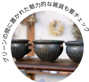
グリーンの中に置かれた魅力的な雑貨も要チェック

単に花を売るだけの店ではありません。`植物のかけこみ寺。になれたらという想いから、調子の悪い植物の診断や植え替えの相談などにも快く応じています。ワークショップも盛んに開催し、植物と人とのご縁を結んでいます。店内のカフェでは自然派の農家から仕入れる牛乳、小麦粉、卵、野菜などを使い、スイーツやキッシュなどの軽食類まですべて手作り。緑に囲まれて居心地も良く、頂くものがおいしくて、ついつい長居してしまいそうです。