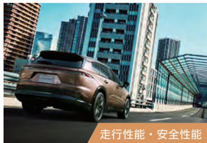
走行性能・安全性能

アウトドアギアを積み込むもよし。休憩スペースとして活用するもよし。圧倒的な広さと共に、気配りが施された心安らぐ空間へ。