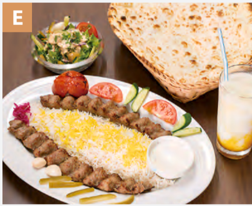
Ali's Kebab 土浦本店 [P.9]

季節感をたいせつにするイタリアンレストラン。食材の中でもっとも季節を感じやすい食材、野菜へのリスペクトを感じます。サラダに使われるリーフ類はシャキッとフレッシュ。グリルされた根菜類はじつくりと旨味が引き出されています。