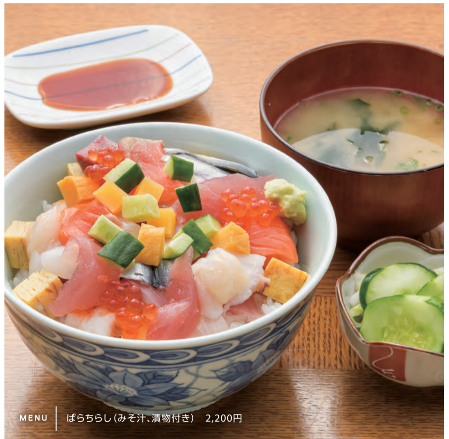
MENU | ぱらちらし(みそ汁、漬物付き) 2,200円

北茨城市磯原町本町3-3-1 Tel.0293-42-0014 営業 11:00～13:30、17:00～21:00 (LO 20:00) 休 日曜、第2・4月曜 P 6台