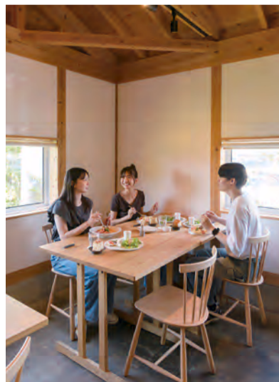
左) ランチはコースまたは3種類のランチセットから。写真は2,400円のランチセットで、パスタは「雲丹 青のりオイルパスタ」(+800円)をチョイス。奥の「季節の前菜5点盛り」には旬の食材がふんだんに。お品書きの説明が親切です。右) 座った時の目線に合わせた窓が印象的。