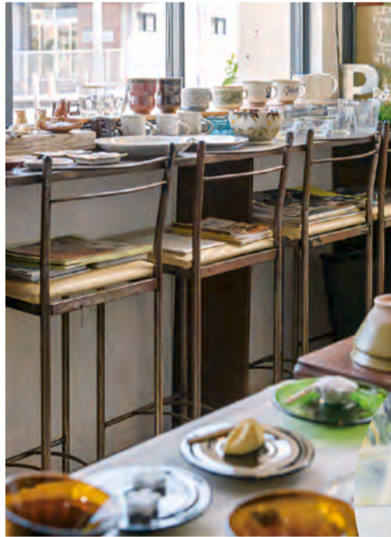
上) 取材時は「山のこと “つべこべ言わずに山へゆけ” という企画展を開催中でした。作品に添えた説明文も興味深く、登山をする人もしない人も楽しめる内容です。左下) 天気の良い日は店先がカフェスペースに。移動販売の「旅するプント」号がコーヒーや本を販売しています。右下) 陶器類は常時セレクトされています。