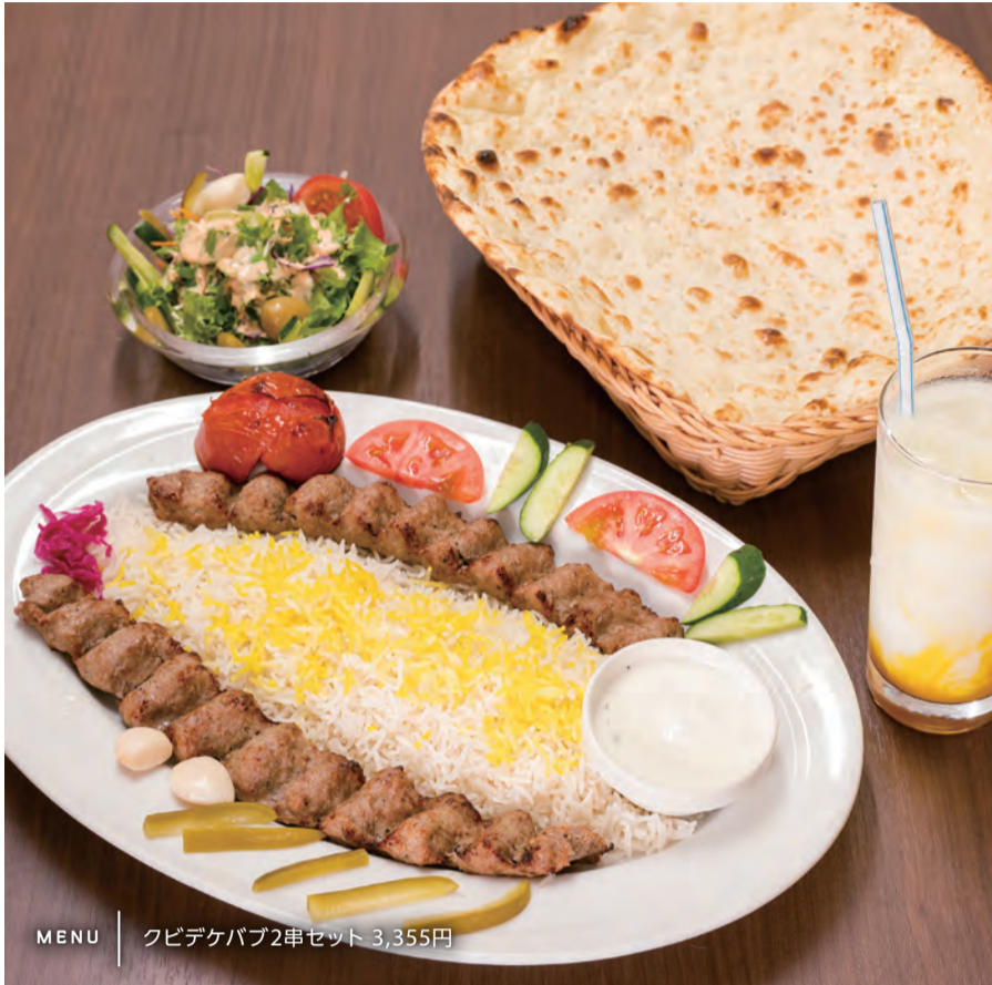
MENU | クビデケバブ2串セット 3,355円