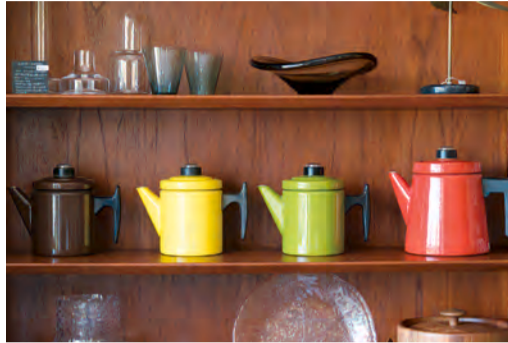
左) JR常磐線の列車から明かりが灯る窓辺が見える雑貨店。右上) 一つ一つ職人が宙吹きで作る、ミラノ発「イッケンドルフ」のグラス。右下) 時代を超えて愛されるポップなデザイン「フィネル」のコーヒーポット。