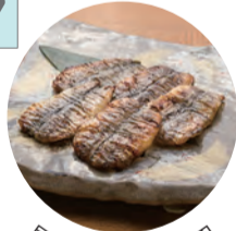
目光の一夜干し 700円

北茨城市磯原町本町3-3-1 Tel.0293-42-0014 営業 11:00～13:30、17:00～21:00 (LO 20:00) 休 日曜、第2・4月曜 P 6台