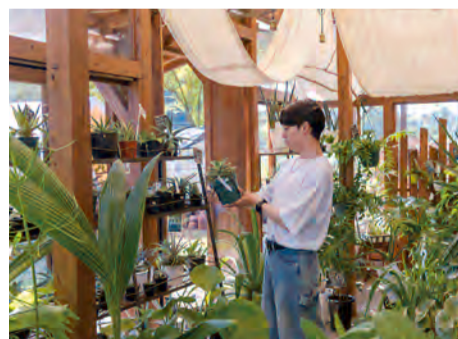
上) 店内の一角に設けられた「結カフェ」。ギャラリーとしても活用されています。左下) カフェで人気の「平飼卵ときび砂糖の昔ながらのプリン」(400円)。右下) 店の内外にはたくさんの植物が並び、センスの良い寄せ植えの鉢はどれも素敵で選びがいがあります。

デザイナーとして活動しながら多くのアートやクラフト作品に触れてきた店主と奥さま。「punto」のセレクト商品には愛嬌を感じるものが多くて楽しいのです。ランチで訪れた「Nulla」では、手頃な価格でコース料理が頂けます。年齢を問わず幅広いお客さまで賑わっています。