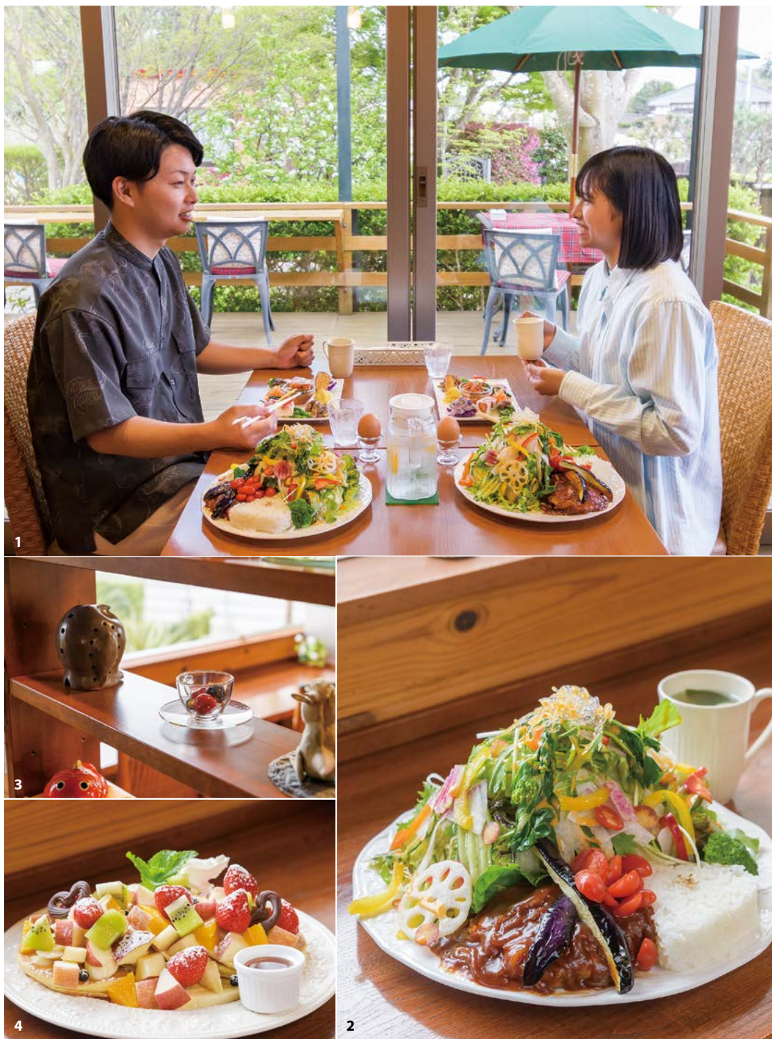
1.「気まぐれランチ」 週替わりのコース(前菜、ゆで卵、スープ、季節の野菜サラダ、特製ハンバーグ、ライス、デザート、ドリンク付で1,800円)。テーブル奥の四角いお皿が前菜で、10種類ほどのお惣菜が盛り合わせられている。2.質・量共に徐々にパワーアップしてきたという「気まぐれランチ」コースのメインプレート 3.店内では、オーナーや知人によるハンドメイド作品の販売も。 4.フルーツがふんだんに添えられた人気の「パンケーキ」(950円)もかなりのボリューム。

道路から一段高い場所に建つ「コーヒーハウスアモル」。雑木に囲まれた建物はそこだけ避暑地のような趣があり、ランチは予約必至の人気店です。