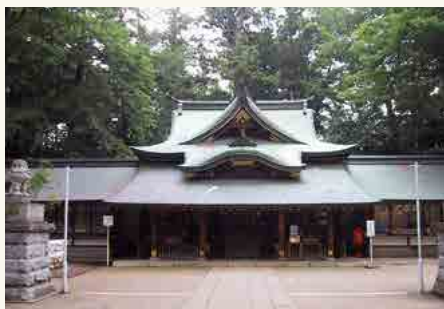
一言主神社 常総市大塚戸町875 ①0297-27-0659