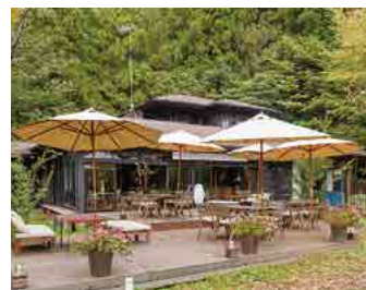
1.「咲くカフェ」の「カンパーニュサンドプレート」(スープ・ドリンク付き 1,350円)。その他のメニューもバリエーション豊か。 2. ゲストハウスは2部屋。「ブラウンルーム」の内観。 3. 建物のある斜面の上から、緑あふれる駐車場方向を望む。