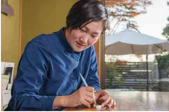
消しゴムはんこを製作する際、彫っていく時に出る消しゴムの彫りカス。それをなんとかリサイクルできないかと常々考えている。

れを続けていますから、どれだけの子どもたちにはんこを作ってきたのか、けっこう膨大な数になるはずですよ。自分の誕生日が近づくと「こんなはんこを作って欲しい」と子どもたちのリクエストがあったりするんです。一方、自分の作品としてはアルファベットをデザインしたものや海外のかわいいと感じた切手シリーズのはんこを作ったりなど、その時々で面白いと感じた新しいモチーフも増えてきました。カフェなど、お店のロゴやTシャツに擦してデザインするためのはんこも口コミで依頼をいただくこともあります。昔からものを手作りすることが好きな私にとって、もの作りは消しゴムはんこだけではないと思っています。いつまではんこを作るつもりかは自分でもわかりませんが、はんこ作りを楽しく感じている限り、そして気に入ってくれる誰かがいる限り、消しゴムを「ほりほり」していくんだと思います。