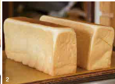
1. パン工房「サンローラン」店内。デニッシュ系、ハード系、菓子パン、惣菜パンと種類豊富。ケーキ類も販売している。 2. 絹のようになめらかな食感が人気の食パン「シルクタッチ」(1斤 378円)。 3. 懐かしさからリピーターの多い「アンフライ」(あんこ、クリーム、うぐいすあん、各 129円) と、「ベトナムハムと卵のバインミー」(500円)。