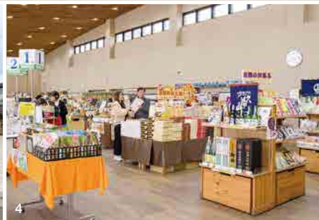
1.「ジェラート&スムージー」のケーキ。上から「ブルーベリータルト」(400円)、「チョコレートのタルト」(300円)、「フロマージュ」(390円)。2. 御前山産柚子「多田錦」をたっぷりを使用した濃縮ジュース「柚子きれい」(1,300円)と、茹でたパスタに和えるだけで手軽に柚子ペペロンチーノができる「ゆずパスタソース」(840円)。3.「かわプラザ」の裏手には開放的なデッキ、親水広場、手ぶらで行っても楽しめるバーベキュー施設などがある。(バーベキューは2日前までの予約制) 4. お買い物しやすい広々とした直売所。 5. 駐車場も広く確保されているので、週末や祝日の混み合う日でも安心。